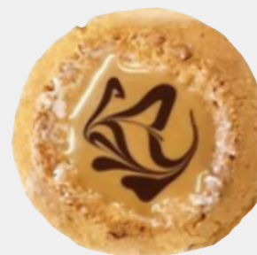
ココナッツマカロン 2個