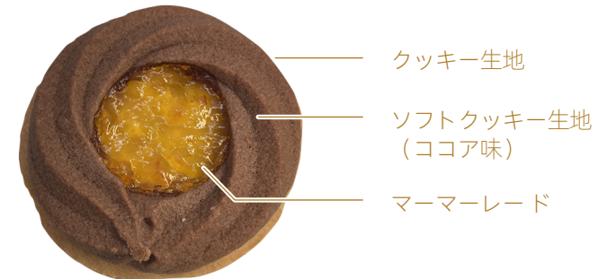
【オレンジタルト】 1個

真珠のような丸いクッキーを生地に四角く並べ、チェダーチーズ風味のチョコを絞り込みました