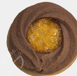
オレンジタルト 1個