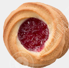
ブルーベリーサン 2個