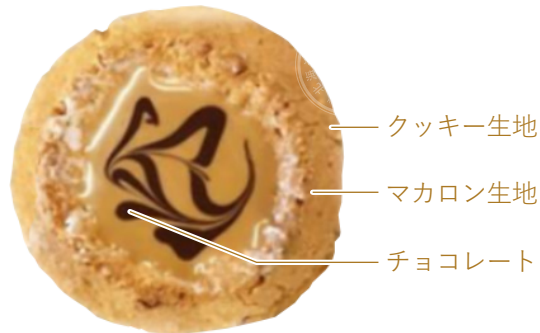
【ココナッツマカロン】 2個

メレンゲにココナッツを練り込み職人がひとつずつ丁寧にマーブルチョコを描いた香ばしい味わいです。