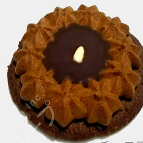
チョコアーモンド 2個